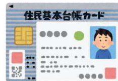
住民基本台帳カード