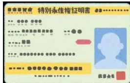
特別永住権証明書